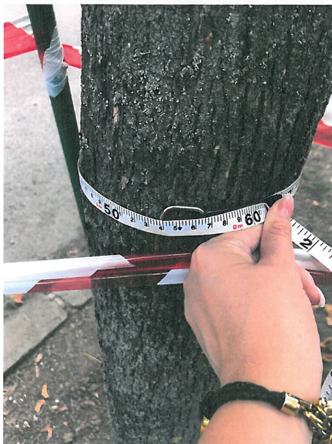
218. sorszámú 54 cm törzskörméretű korai juhar (Acer platanoides)