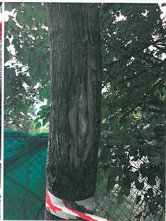
219. sorszámú 65 cm törzskörméretű korai juhar ( Acer platanoides )