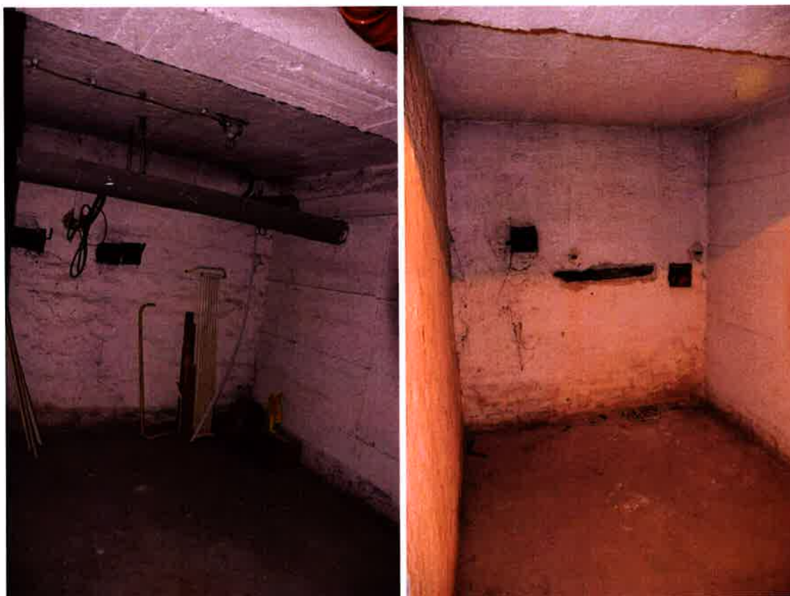
belső kialakítás fotói