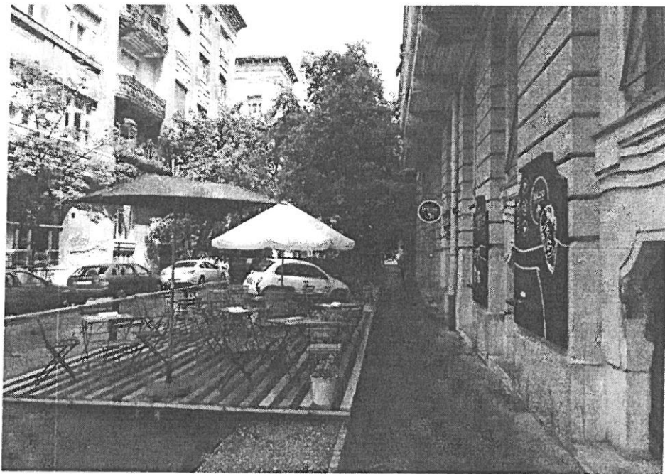
3. ábra. A Bölcső terasza a Lágymányosi utca 19. előtt 2018-ban

A terasz megjelenése nem tolakodó, borításának anyaga fa, domináns színei a zöld, sárga, törtfehér. Reklámokat, cégek logóit nem jelenítjük meg, zöld növényzettel díszítjük.