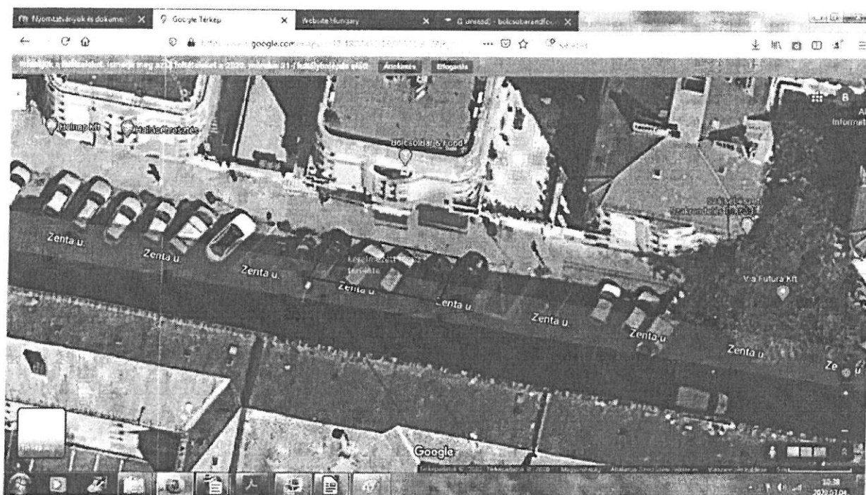
2. ábra. A tervezett terasz helye a Google műholdképén

A terasz tervezett kialakítása sem a gyalogos forgalmat, sem a gépjármű forgalmat nem befolyásolja, mivel a járdát és az utat is teljes szélességében meghagyja.