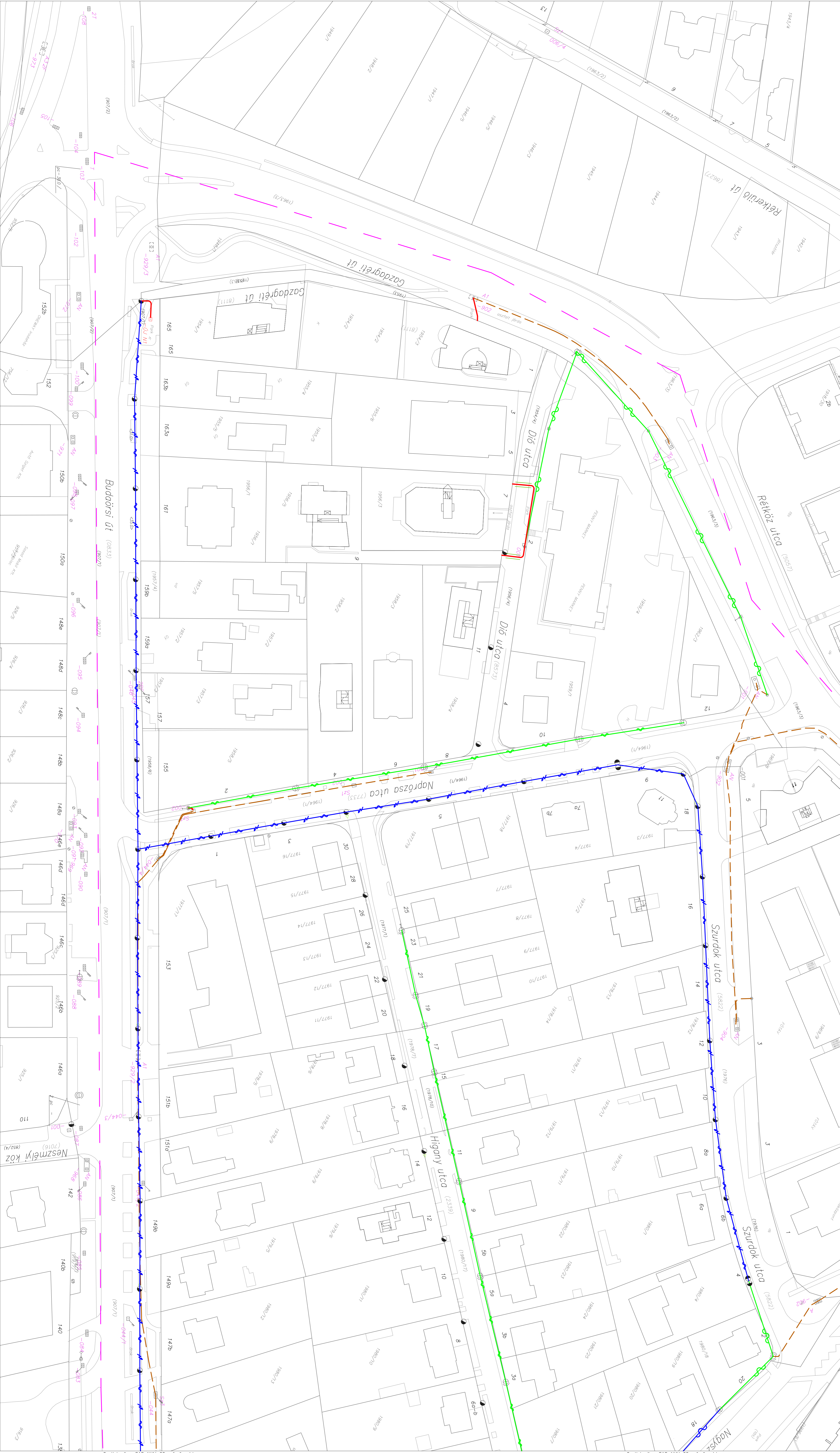
Csatlakozik a SAS-NYV-02 számú rajzhoz