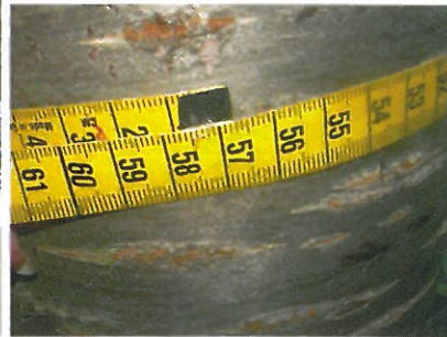
6. sz. japáncseresznye