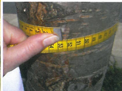
8. sz. japáncseresznye