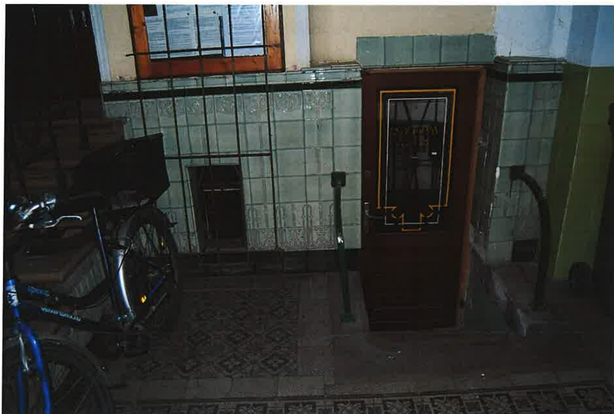
Befogadó épület és megközelíthetőség