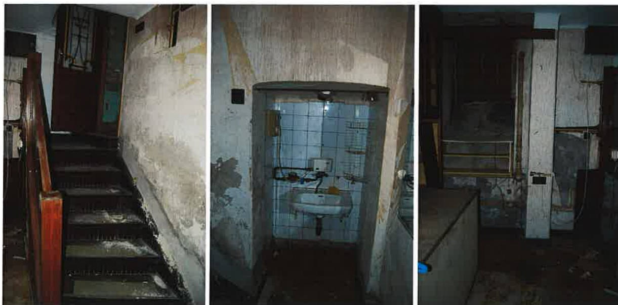
A helyiség belső kialakítását bemutató fotók