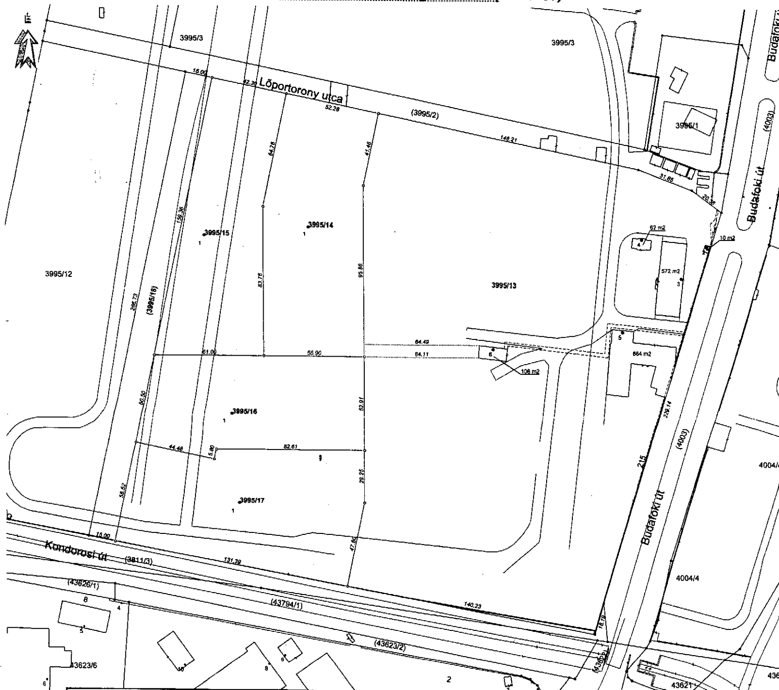
Kimutatás a telkek beépítettség mértékének változásáról

a 3995/11 hrsz-ú földrészlet megosztásáról (T-100437)