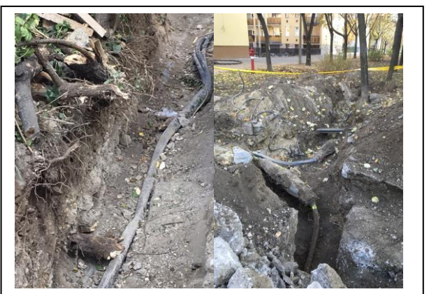
Közműcsere és kábeljavítás ma a területben