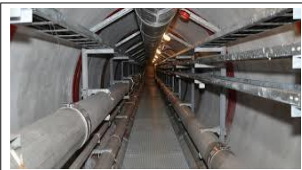
Duna alatti közműalagút Visegrád és Nagymaros között