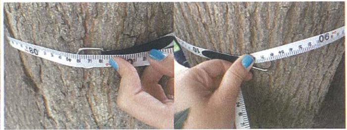
341. Tilia tomentosa