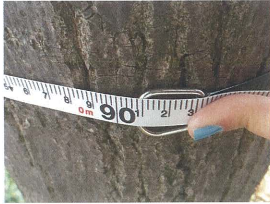
339. Acer negundo