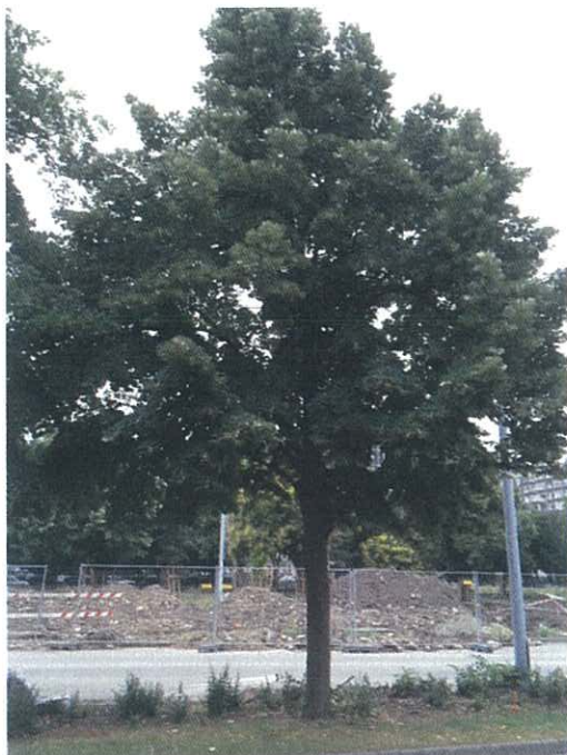
343. Tilia tomentosa