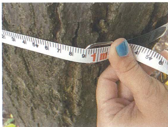
340. Tilia tomentosa