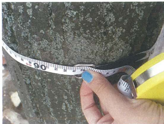
342. Tilia tomentosa