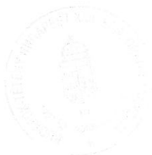
Kamarás Dorottya főépítész