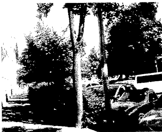
Nehezíti a helyzetet,hogy sövények miatt az autósok csak a közúton tudják elhagyni a parkolót. Így személyforgalommal is számolni kell. (Készült: 2017. szeptember.)