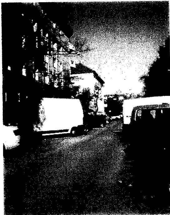
Belógó autók akadályozzák a közlekedést a Bukarest u.3-11-sz. közötti útszakaszon. Felfestett útszegély esetén erre aligha kerülne sor. (Készült :2017.november.)