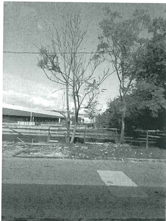
17. Ailanthus altissima