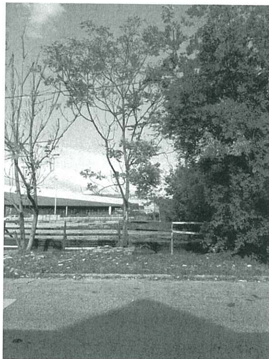
16. Ailanthus altissima