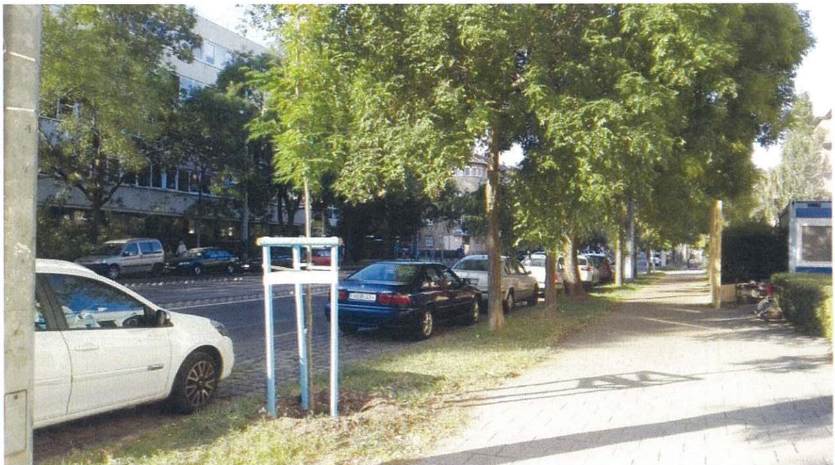
Budapest, XI. kerület, Bartók Béla út 105-113. sz., 3406/1 hrsz-ú ingatlan előtti, Bartók Béla út (3409/1) hrsz-ú közterület, 2017.08.31.