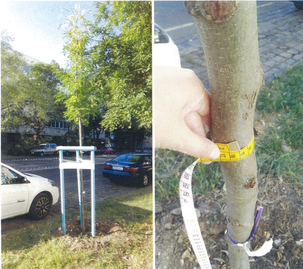
Budapest, XI. kerület, Bartók Béla út 105-113. sz., 3406/1 hrsz-ú ingatlan előtti, Bartók Béla út (3409/1) hrsz-ú közterület, 2017.08.31.