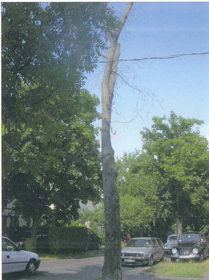
Budapest, XI. kerület, Csorbai út 22/B előtt (2929) hrsz., 2017.06.21.