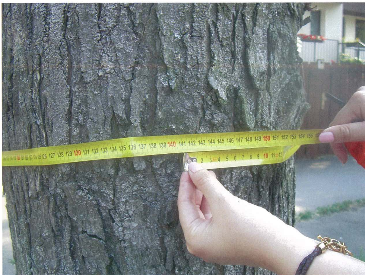
Budapest, XI. kerület, Csorbai út 22/B előtt (2929) hrsz., 2017.06.21.