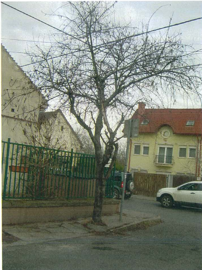
2. sz. meggyfa Budapest XI. kerület, Inotai utca 25. sz. előtti 44094 hrsz. 2017. 03. 07.