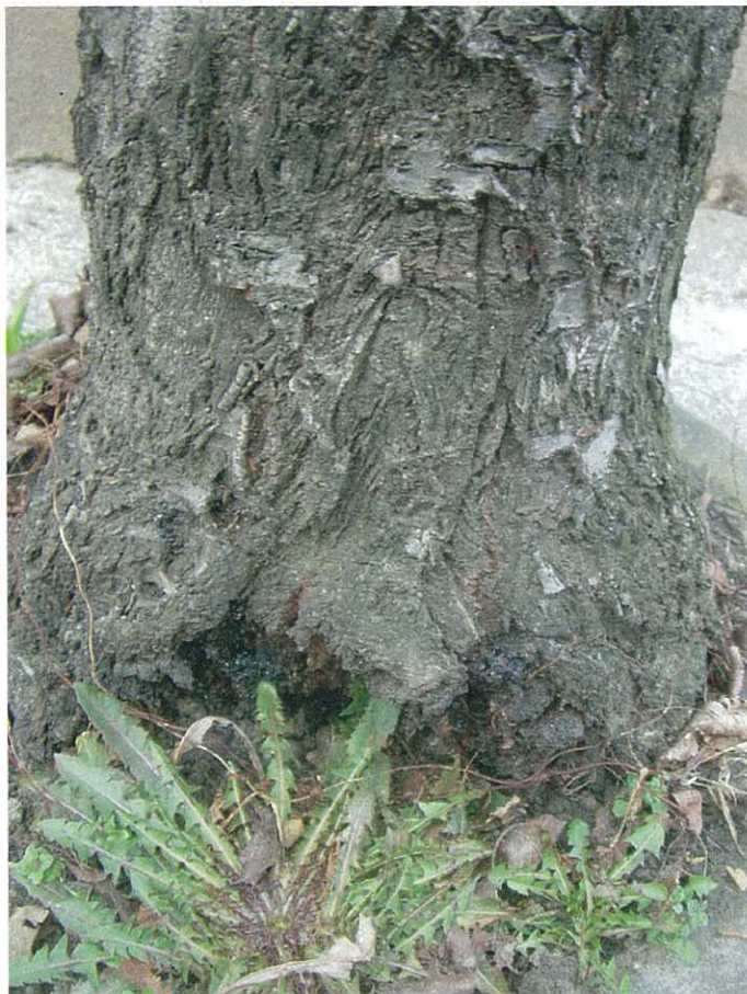
1. sz. meggyfa Budapest XI. kerület, Inotai utca 25. sz. előtti 44094 hrsz. 2017. 03. 07.