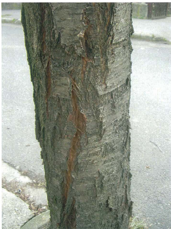
2. sz. meggyfa Budapest XI. kerület, Inotai utca 25. sz. előtti 44094 hrsz. 2017. 03. 07.