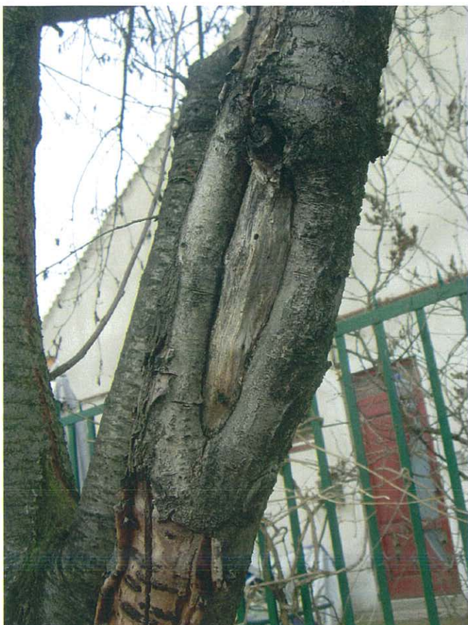
2. sz. meggyfa Budapest XI. kerület, Inotai utca 25. sz. előtti 44094 hrsz. 2017. 03. 07.