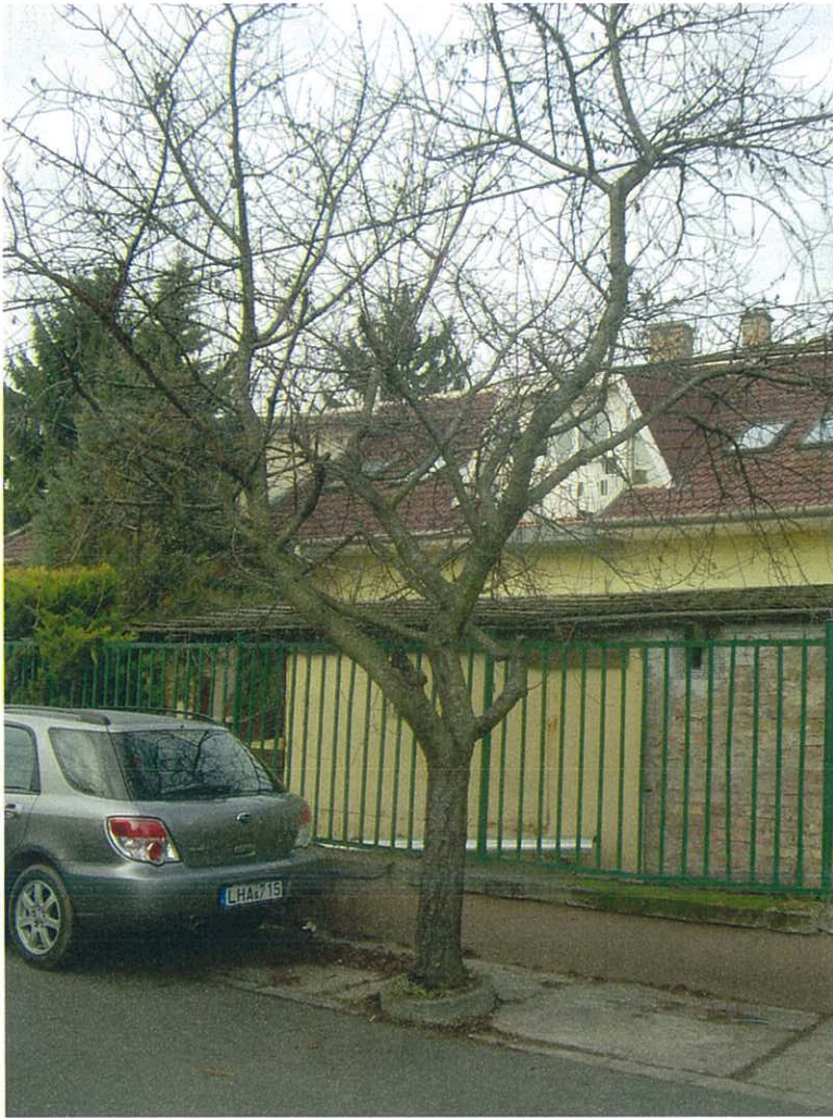
1. sz. meggyfa Budapest XI. kerület, Inotai utca 25. sz. előtti 44094 hrsz. 2017. 03. 07.