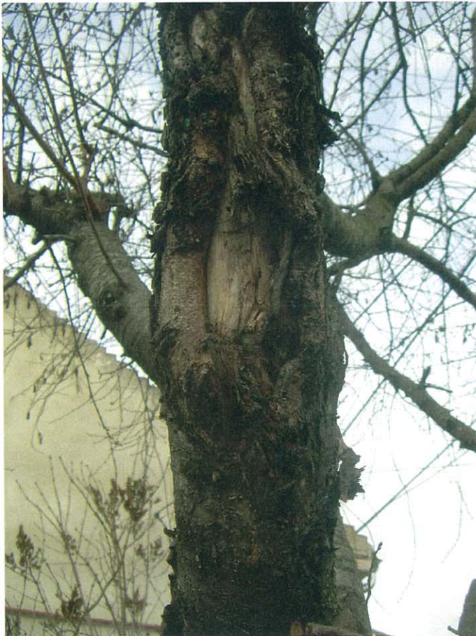
2. sz. meggyfa Budapest XI. kerület, Inotai utca 25. sz. előtti 44094 hrsz. 2017. 03. 07.