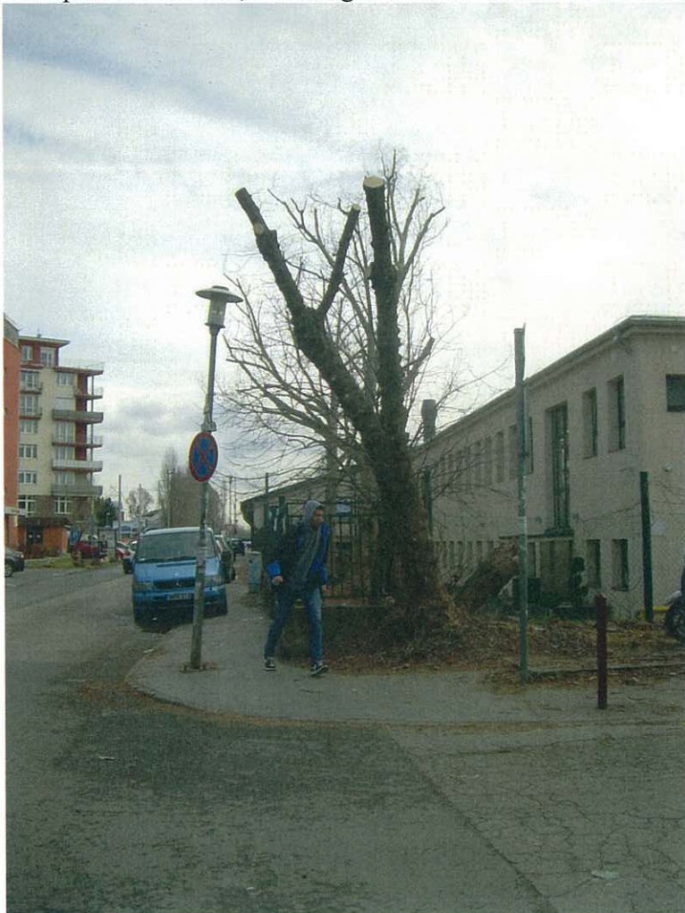
Budapest XI. kerület, Nádorliget u 10. sz. előtti 3971/1 hrsz. zöld juhar, 2017. 03. 06.