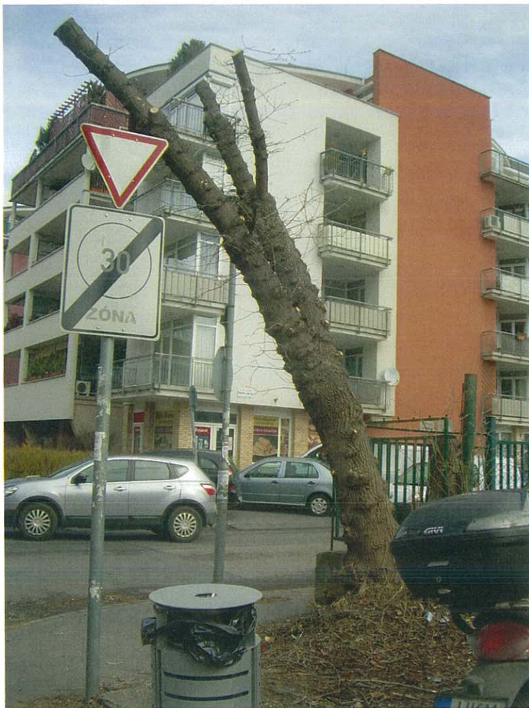
Budapest XI. kerület, Nádorliget u 10. sz. előtti 3971/1 hrsz. zöld juhar, 2017. 03. 06.