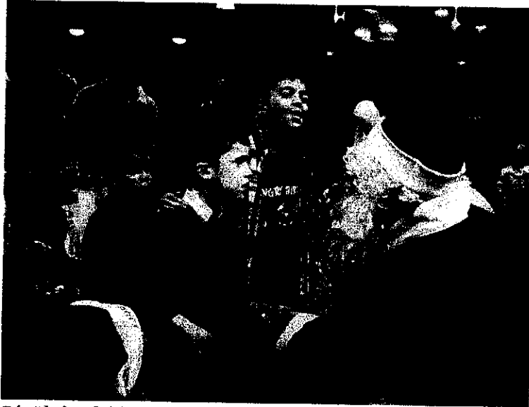
Sérült kisfiú köszönti bátyjával a Télapót az FMH-ban

Néhány fotó az alapítvány életéből 2016-ban: