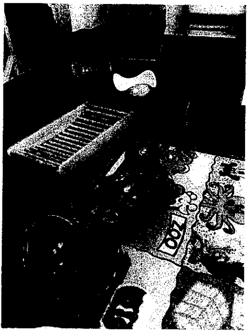
A 4 színű új Bilibok