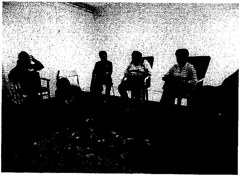
Sérült gyermeket nevelő szülők számára szervezett tréningünk