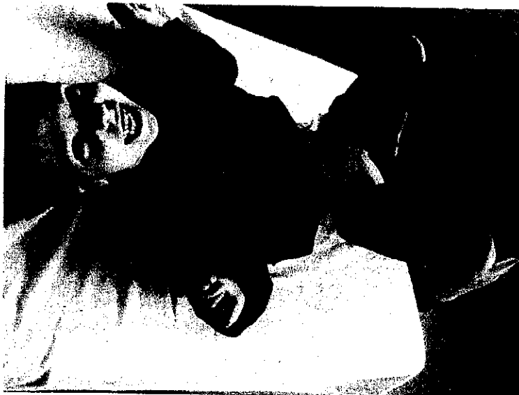
Mozgássérült kislány vidáman a Pfaffenrot manuális technika gyakorlati bemutató workshop-ján